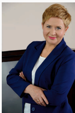
Beata Klimek Prezydent Ostrowa Wielkopolskiego