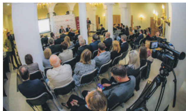
Spotkanie cieszyło się dużym zainteresowaniem, a omawiane tematy są bardzo aktualne i ważne

Konferencja pokazała, że Ostrów Wielkopolski staje się jednym z liderów w Polsce, jeśli chodzi o wdrażanie nowoczesnych rozwiązań z zakresu cyberbezpieczeństwa. W wydarzeniu wzięli udział przedstawiciele miejskich instytucji i spółek.