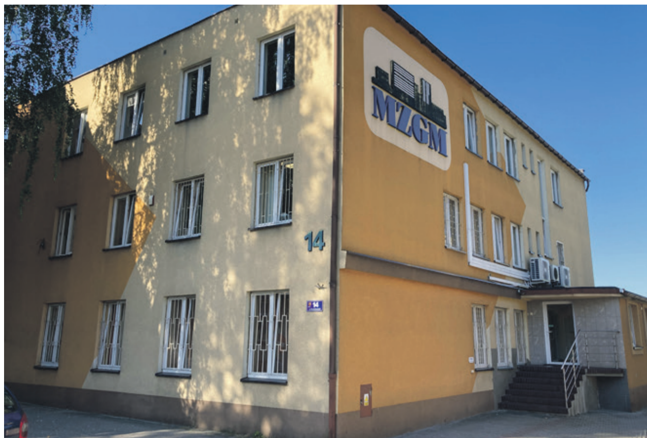
■ Siedziba Miejskiego Zakładu Gospodarki Mieszkaniowej przy ulicy Kościuszki 14 w Ostrowie Wielkopolskim

■ Miejski Zakład Gospodarki Mieszkaniowej obchodzi 30-lecie swojego powstania. Od 29 listopada 1994 roku Spółka funkcjonuje jako Miejski Zakład Gospodarki Mieszkaniowej „MZGM” sp. z o.o. Historia gospodarowania mieszkaniowymi zasobami miasta jest jednak znacznie dłuższa.