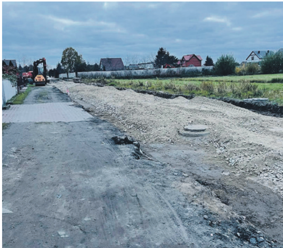
■ Ulica Łąkowa. I etap drogi jest już gotowy. II etap to kolejny odcinek nawierzchni. W sumie powstanie tu blisko kilometr nowej drogi