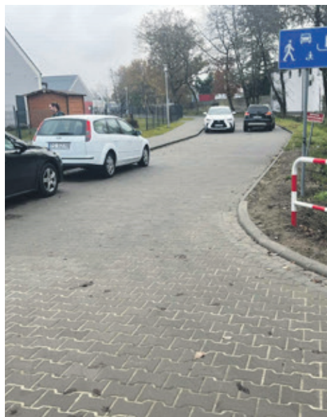
■ Prace drogowe na ulicy Zduńskiej zostały zakończone. To droga na której szczególnie zależało rodzicom pobliskiego przedszkola Jarzębinka i mieszkańcom osiedla