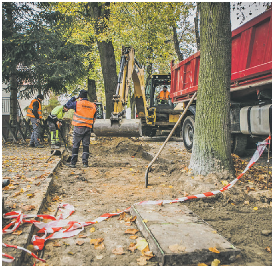
■ Na Osiedlu Robotniczym w listopadzie ruszyła przebudowa chodników