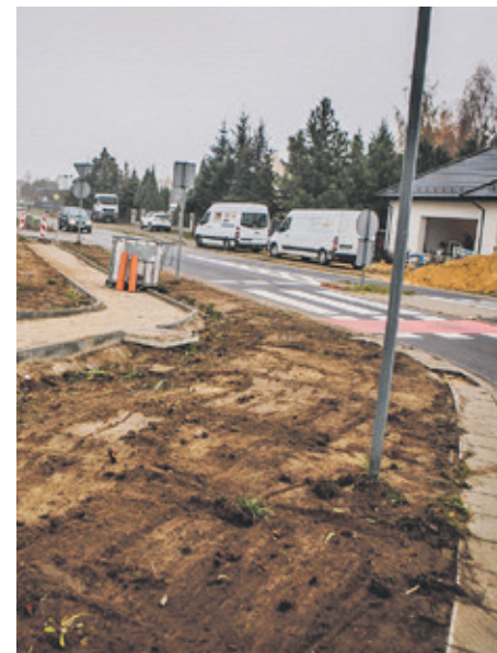
■ Na ulicy Krakowskiej trwa budowa chodnika na odcinku od ulicy Kujawskiej do ulicy Grunwaldzkiej. Prace zakończą się jeszcze w tym roku