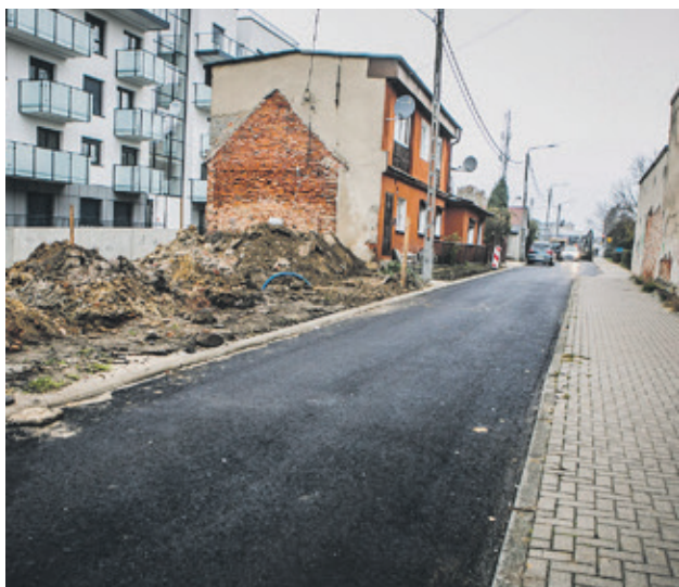
■ Przebudowa ulicy Wąskiej to wymiana nawierzchni drogi i chodnika. Powstaną tu również nowe krawężniki, zjazdy i dodatkowe wpuasty deszczowe

Ostatnie lata to czas, gdy w Ostrowie Wielkopolskim realizowano duże, wielomiejscowe inwestycje. Były to między innymi II etap Północnej Ramy Komunikacyjnej, przebudowa skrzyżowania ulicy Wrocławskiej z Brzozową, czy przebudowa Ronda Bankowego. Teraz przyszedł czas na budowę dróg osiedlowych i lokalnych, stąd ten program. W pierwszej kolejności budowane są drogi, które mają już gotową dokumentację techniczną i pozwolenie na budowę.