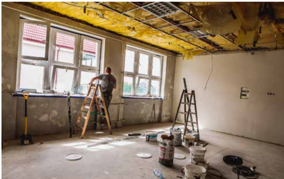
■ W ostrowskiej „szóstce” na remonty i modernizacje samorząd wyda ponad 564 tys. złotych