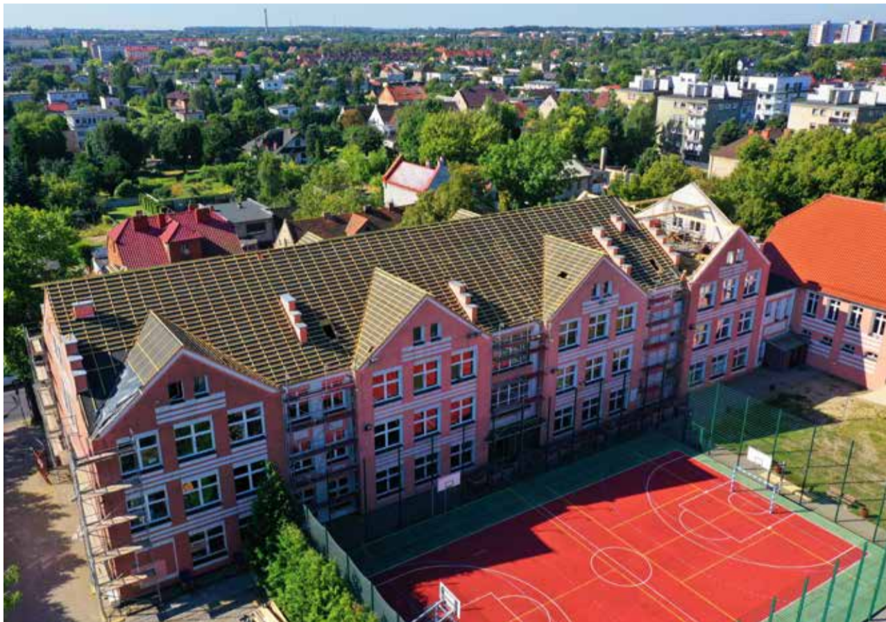
■ Szkoła Podstawowa nr 5 będzie miała nowy dach

Wiele z prowadzonych prac zakończy się jeszcze przed rozpoczęciem roku szkolnego 2025/2026, dzięki czemu uczniowie powrócą do odnowionych i lepiej wyposażonych przestrzeni.