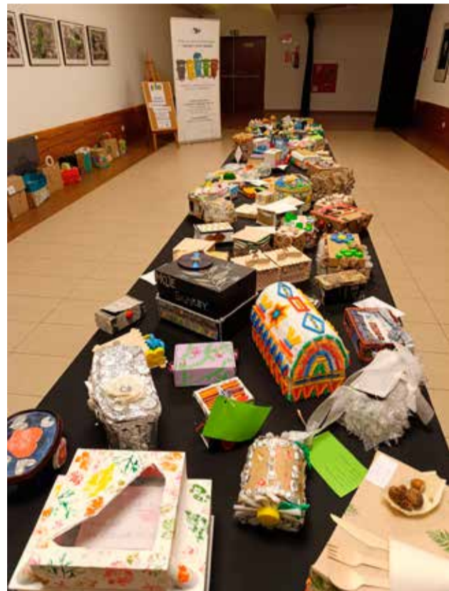
■ W poprzednich latach młodzi twórcy, uczestnicy konkursu, popisali się dużą kreatywnością

Prace można dostarczać do siedziby MZO przy ul. Staroprzygodzkiej 138 do 6 listopada br., a wyniki konkursu zostaną ogłoszone 25 listopada 2025 r. podczas Gali Finałowej w Ostrowskim Centrum Kultury.