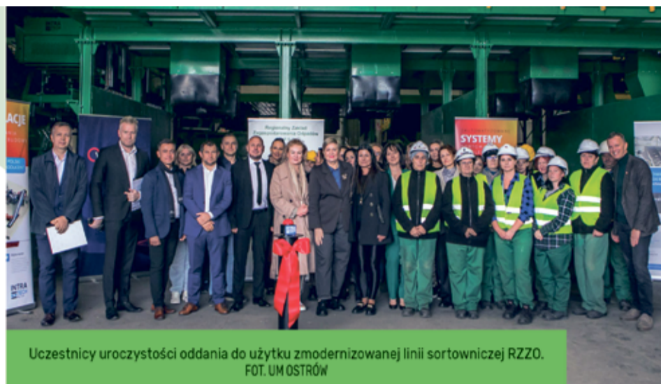
Uczestnicy uroczystości oddania do użytku zmodernizowanej linii sortowniczej RZZO.

Modernizację, która była konieczna do wykonania z powodu wysokiej eksploatacji linii, przeprowadzono bez zamknięcia zakładu, bez przerw w odbiorze i zagospodarowaniu odpadów.